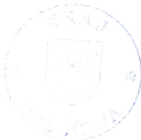
Miloš Vystrčil hejtman kraje

Tato veřejná vyhláška byla vyvěšena 15 dnů na úřední desce